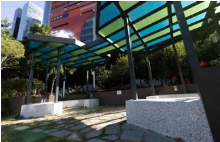
iv. 微型展亭 ( 1 )