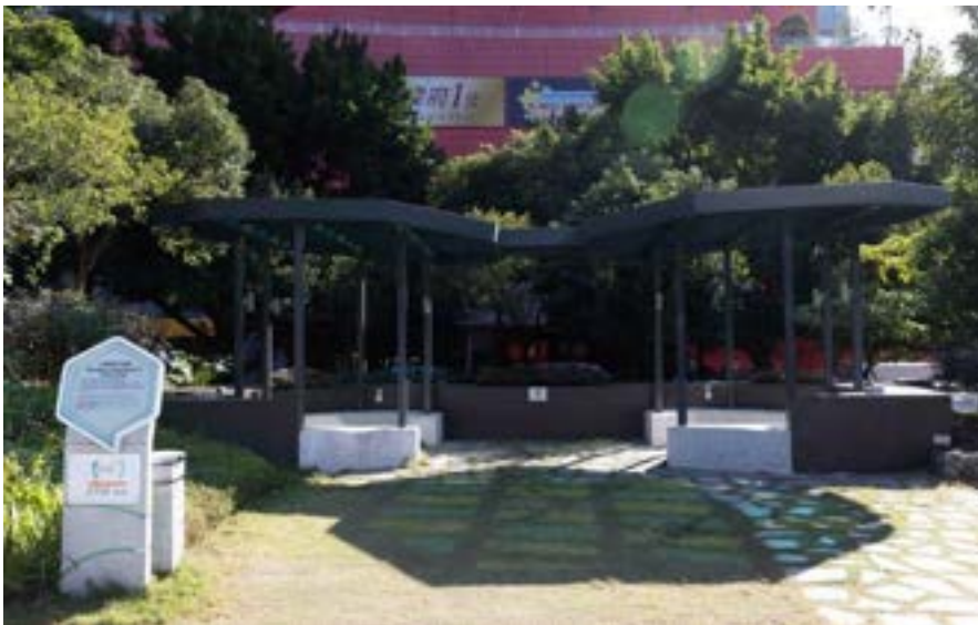
v. 微型展亭 ( 2 )